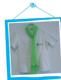
Secretária de Unidade