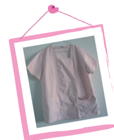
Auxiliares de Alimentação