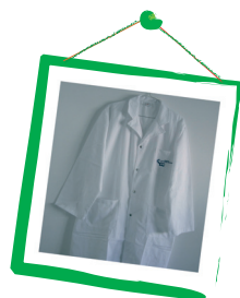
Médico Dietista Assistente Social