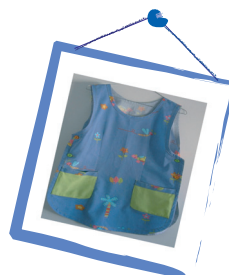
Educadoras de Infância