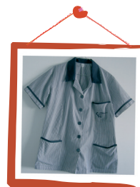
Auxiliares de Acção Médica